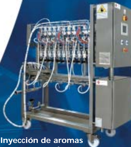
Inyección de aromas concentrados