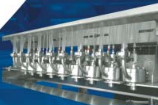
Boquillas dosificadoras de preparación de fruta con trozos