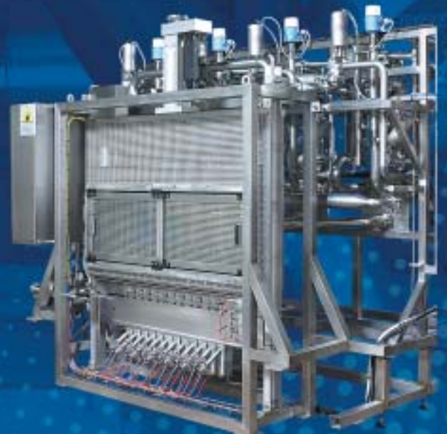
Dosificado de yogur con fruta entera