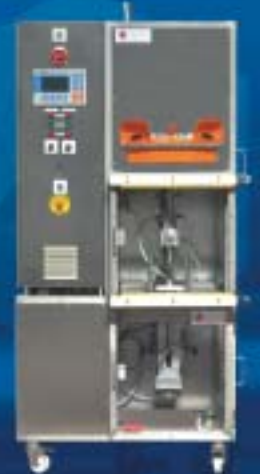
Dosificador para laboratorio de desarrollo de productos